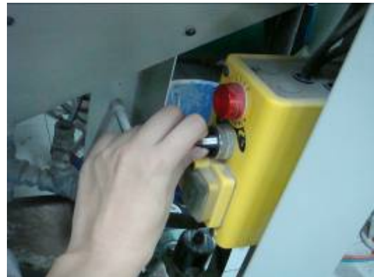
⑧ 把燈從 0 轉到 I，並按下開關的 白色按鈕