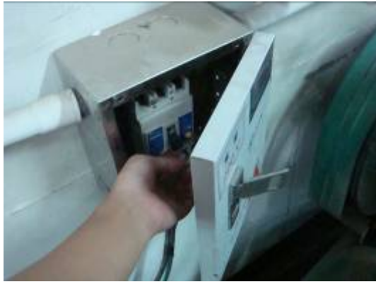
⑦ 打開噴砂機的總電源