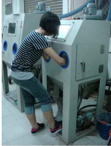
⑫手伸進噴砂機裡，踩下踏板就可開始噴砂。