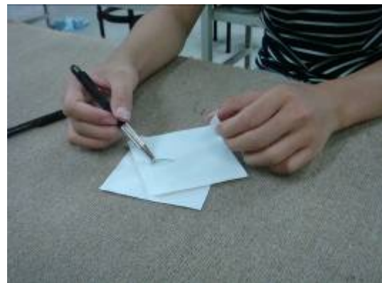
⑥用筆刀把圖案鏤空，就可以去噴砂