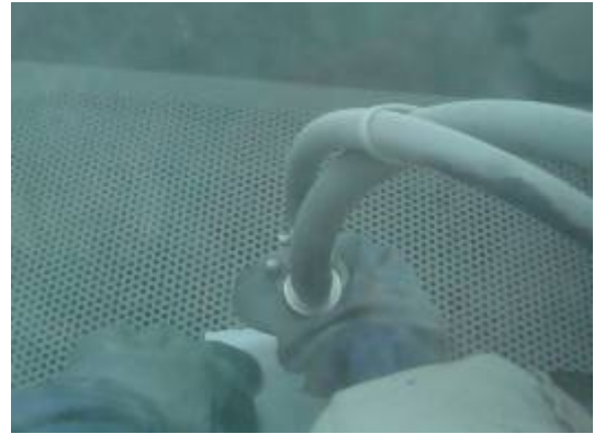
△一隻收握住噴砂機，控制噴砂的位置；另一手壓住玻璃，不讓玻璃移動位置