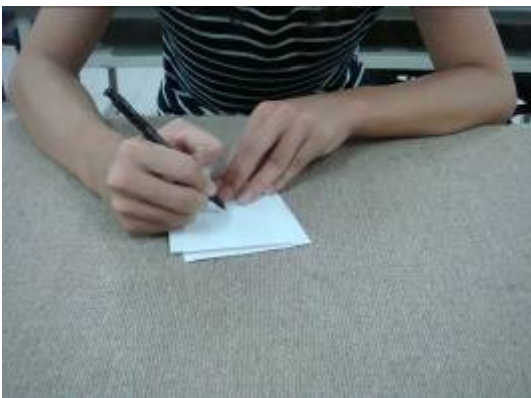
⑤在貼好卡典西德的玻璃畫上圖案。