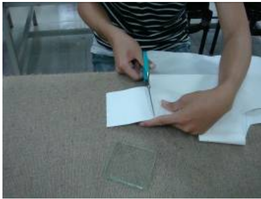
①以玻璃大小去裁切卡典西德