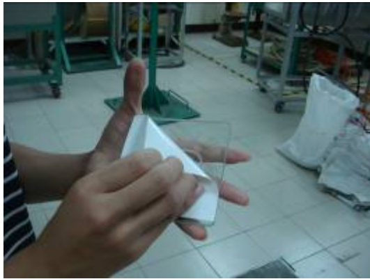
⑬完成噴砂後，就可以從噴砂機拿出作品，並且撕掉卡典西德。