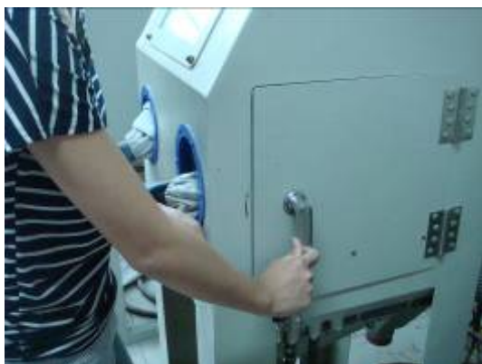
⑪ 關上噴砂機，準備要噴沙囉！