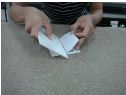
③貼卡典西德時，配合刮板去貼卡典西德，可以減少氣泡。