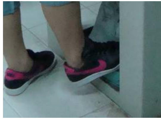
△ 踩一下踏板，噴砂機就啟動，在 在一下就停止噴砂。