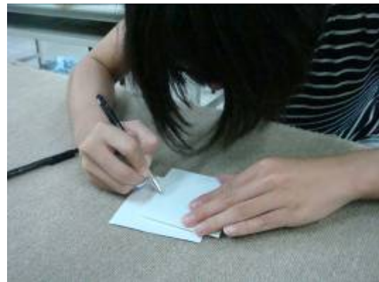
④有些氣泡推不出去時，利用刀劃上一痕，把空氣排出。