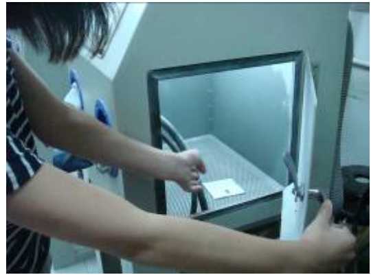
⑩ 把要噴砂的作品放進噴砂機裡