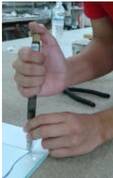
④一隻手在上面施力， 另一手在下面控制左 右的位置。