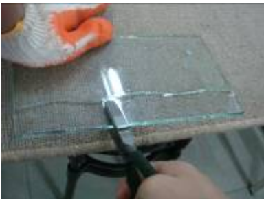
⑨斷層裂到後端時，在輕輕的一 拔，玻璃就會分離。