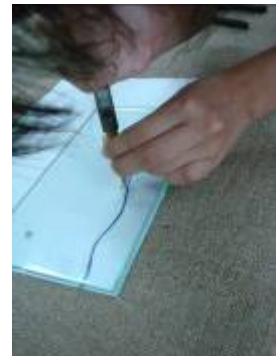
⑥推進時，要對著草稿 前進。