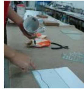
③在要切割的地方，塗