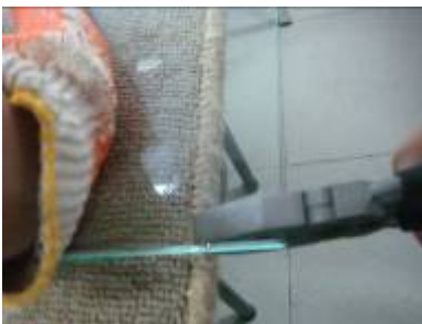
⑦用平鉗沿著切割線施力，從 前端開始壓就會出現斷層。