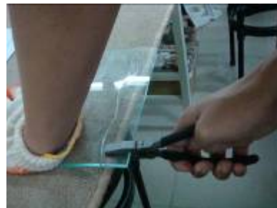
⑧施力時，手要往後拉，同時要 出一點力氣向下壓。