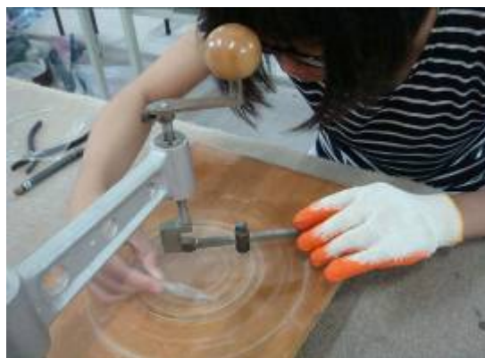
⑤在圓的周圍滴上煤油。