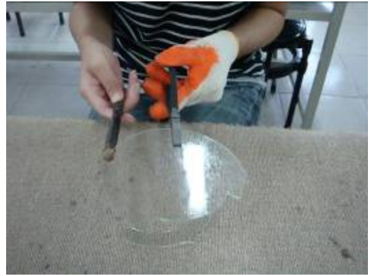
⑬平鉗夾住玻璃，玻璃刀的後端，輕敲剛剛劃的四刀，敲到有斷層。