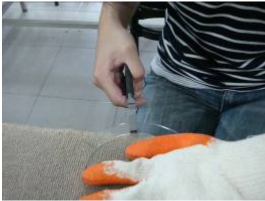
⑭使用平鉗，把多餘玻璃夾掉。