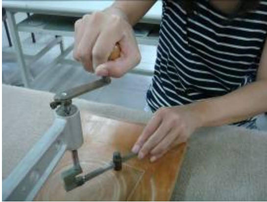
①一手放置旋轉手把上，另一手可放玻璃刀上做輔助；