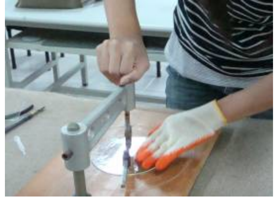
△一手放置旋轉手把上，另一手壓住玻璃，以免滑動。