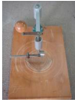
②把玻璃放置圓切割台上。