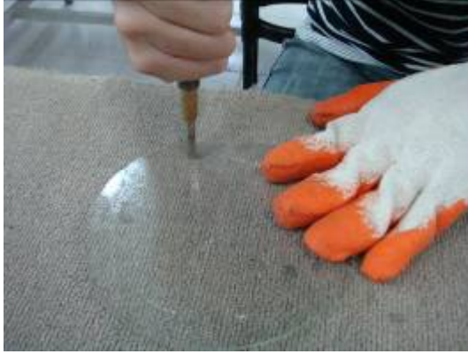
⑫在圓的四周劃用垂直的四刀。