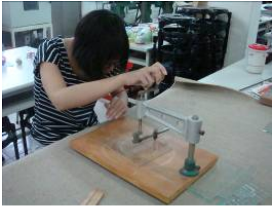
③接著往下壓，把玻璃刀壓在玻璃上。