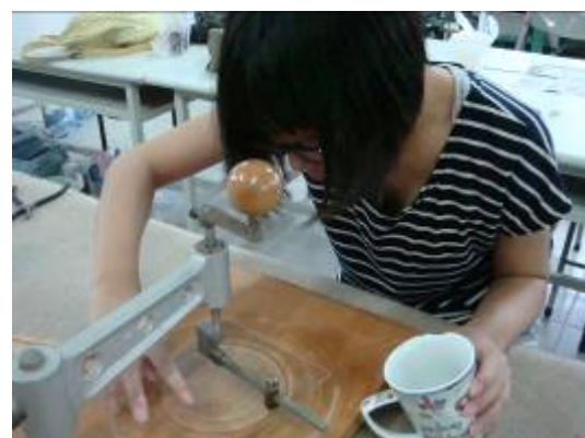
⑥把滴上玻璃的煤油，塗抹成一圈。