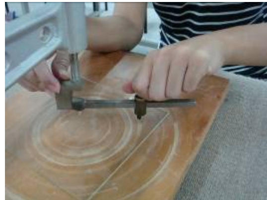
④決定好圓的大小後，轉緊螺絲。